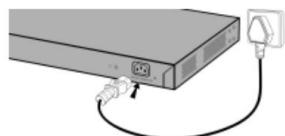
Подключение питания AC 100~240В