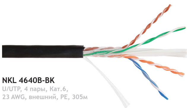
NKL 4640B-BK U/UTP, 4 пары, Кат.6, 23 AWG, внешний, PE, 305м

Маркировочная надпись: NIKOMAX NETWORK SOLUTIONS /// NIKOLAN NKL 4640B-BK U/UTP SOLID CABLE 4P CATEGORY 6 23AWG Class Fca PE OUTDOOR -60C ISO/IEC 11801 & EN 50173 & ANSI/TIA-568-C.2 NVP 0.69 (ZL) 1803 005M