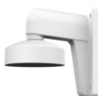
DS-1272ZJ-110 Настенный кронштейн