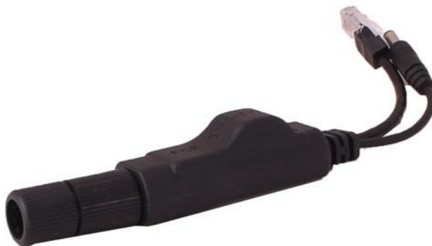
Рис.4 Сплиттер PoE Splitter/2W с присоединенным гермовводом