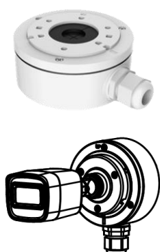
DS-1280ZJ-XS Монтажная коробка