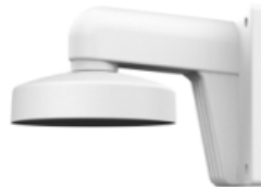
Кронштейн для установки на стену DS-1272ZJ-120