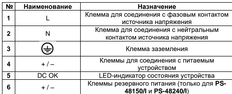
Табл. 1. Элементы блоков питания