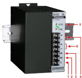
Рис. 2. Блок питания PS-48150/I, PS-48240/I