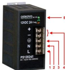
Рис. 1. Блок питания PS-12024/I, PS-48048/I