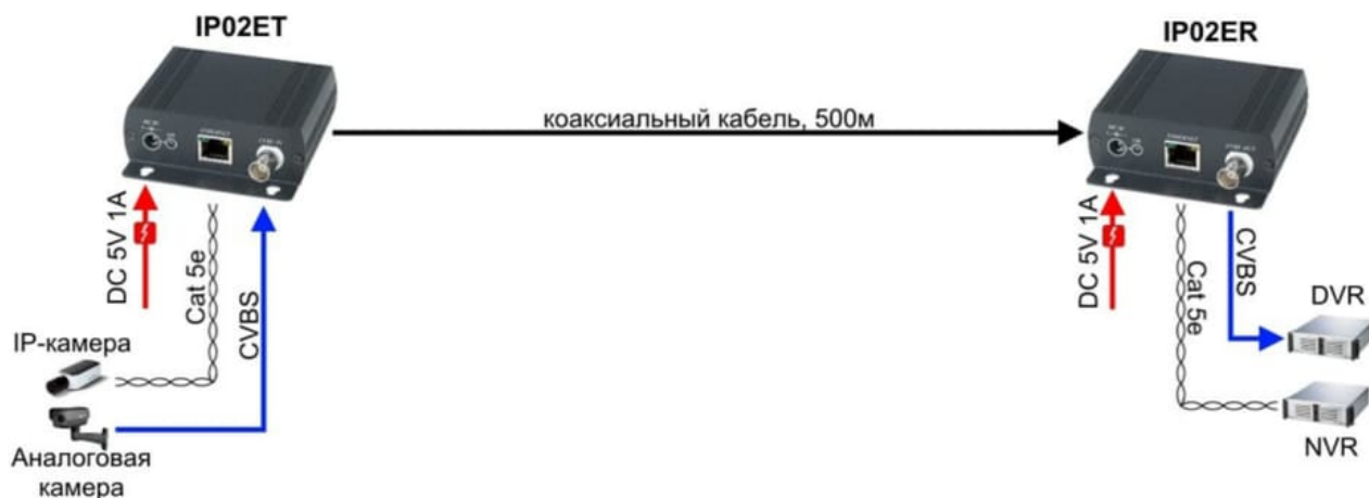
Рис.3 Схема подключения комплекта IP02E