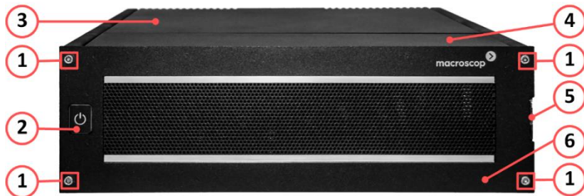
Рисунок 1. Вид спереди